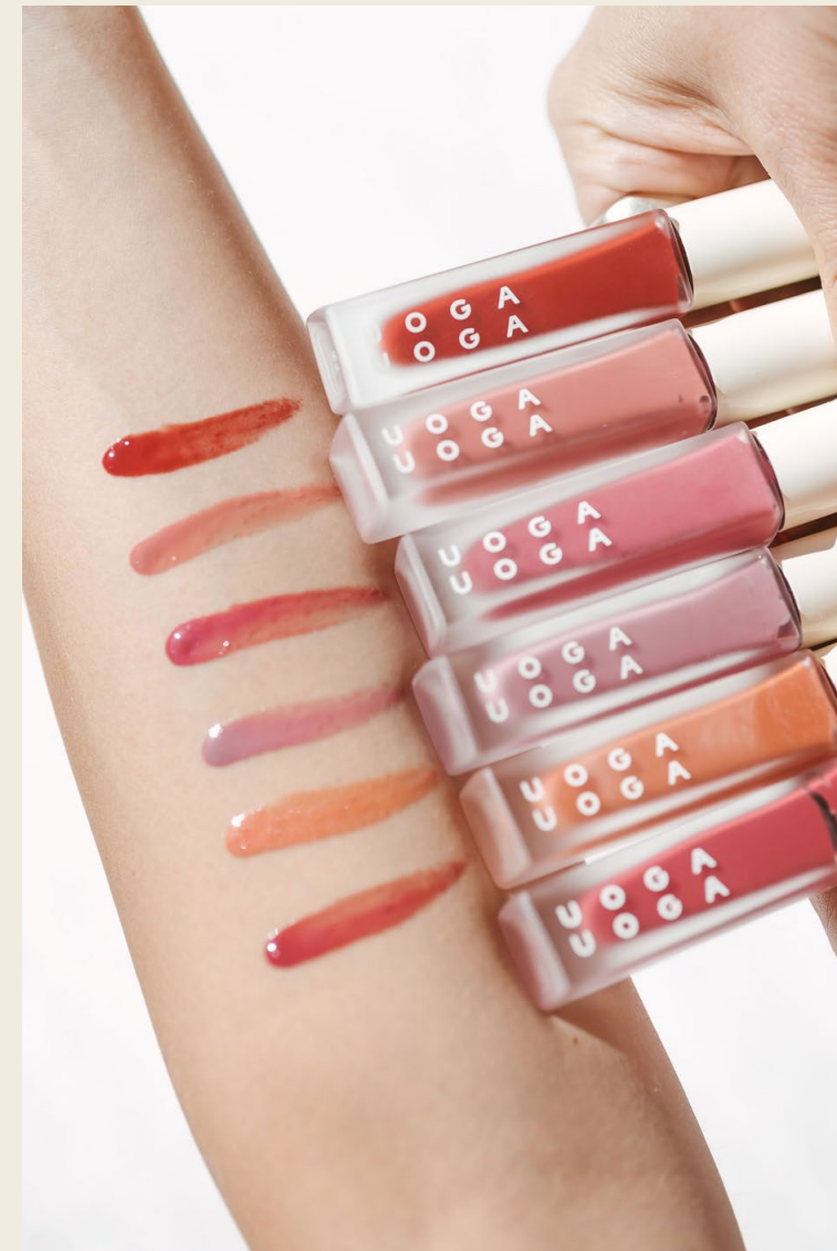
Huulipuna 611 Chocoberry